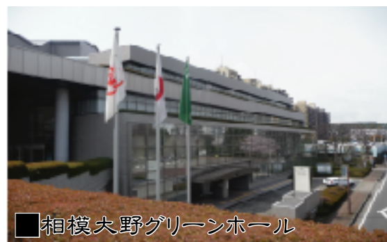
相模大野グリーンホール