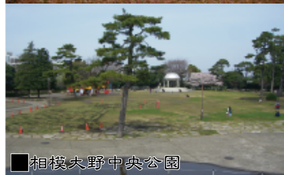
相模大野中央公園

ライフインフォメーション コンビニまで徒歩4分 スーパー三和まで徒歩4分 南大野小学校まで徒歩12分 新町中学校まで徒歩7分